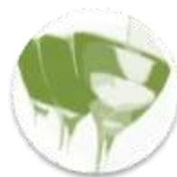
Вино (сухое, полусладкое, игристое)