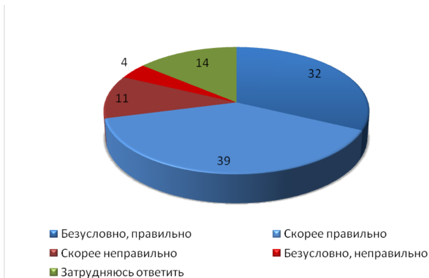
Рисунок 2 - Как Вы считаете, правильно ли поступила Россия, поддержав Южную Осетию в грузино-осетинском конфликте, или нет? (закрытый вопрос, один ответ).