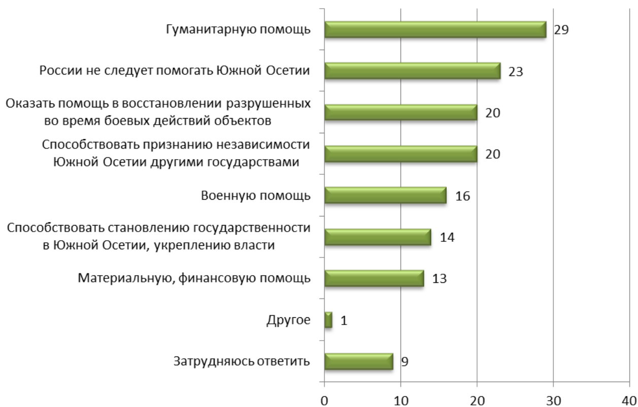
Рисунок 3 - Как Вы считаете, должна ли сегодня Россия оказывать помощь Южной Осетии, или нет? Если да, то какую? (закрытый вопрос, не более трех ответов).