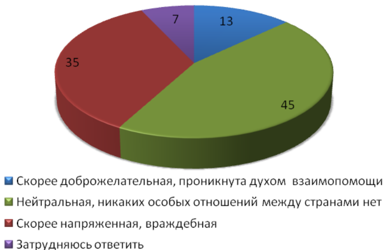
Рисунок 1 - Как Вы в целом оцениваете сегодня международную обстановку, отношения между странами? (закрытый вопрос, один ответ).

Относительное большинство россиян сегодня склонны оценивать международную обстановку как нейтральную (45%). Остальные, однако, чаще указывают на напряженные и враждебные отношения между странами (35%), нежели доброжелательные (13%). Две трети россиян сегодня не видят признаков приближения новой мировой войны (65%). Остальные чаще всего указывают на конфликты на Ближнем Востоке (9%), агрессивную политику США (4%), локальные войны в мире (3%).