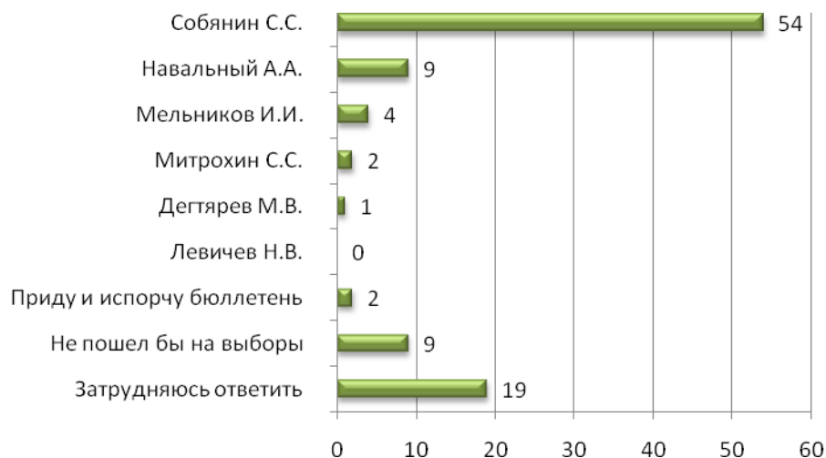
Рисунок 5. Представим, что выборы мэра Москвы состоятся в ближайшее воскресенье. За кого из кандидатов, Вы бы, скорее всего, проголосовали? (закрытый вопрос, один ответ).