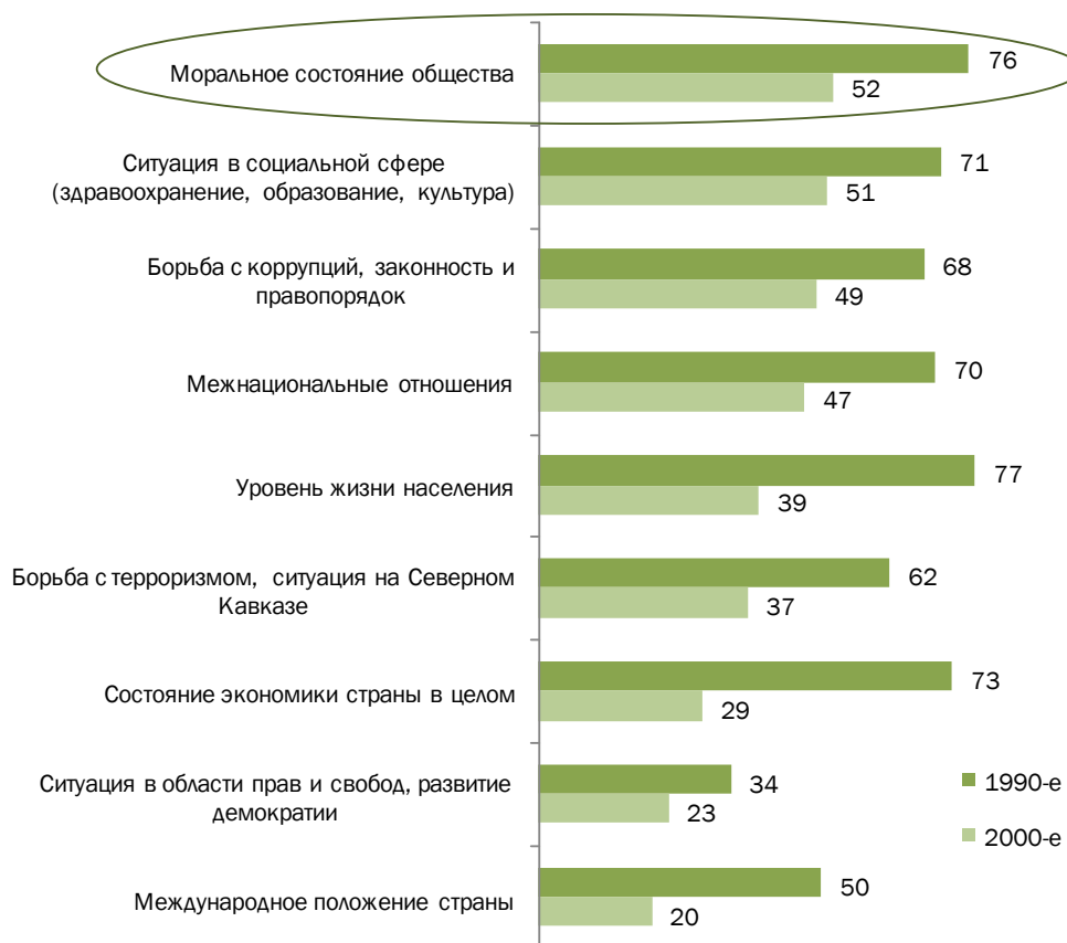
Рисунок 2 - Оценка динамики положения дел в различных сферах жизни российского общества в 1990-е и в 2000-е годы, (закрытый вопрос, один ответ по каждой позиции; приведены данные по позиции «ухудшалось»), %

Однако обратим внимание на одно важное обстоятельство. Сегодня, как и десять лет назад, падение морали в результате реформ воспринимается россиянами, прежде всего, как проблема общества в целом – но не их собственная. И в 2001 году, и сейчас потерей лично для себя падение морали считают лишь 18-19% опрошенных (по сравнению с 32-35% говорящих о потере морали, актуальной для общества в целом). Говоря о себе, гораздо более важными, нежели моральные перипетии, опрошенные считают утрату уверенности в завтрашнем дне, снижение уровня жизни большинства населения, утрату стабильности и чувства безопасности, разделение общества на богатых и бедных, отсутствие социальной справедливости и порядка в стране.